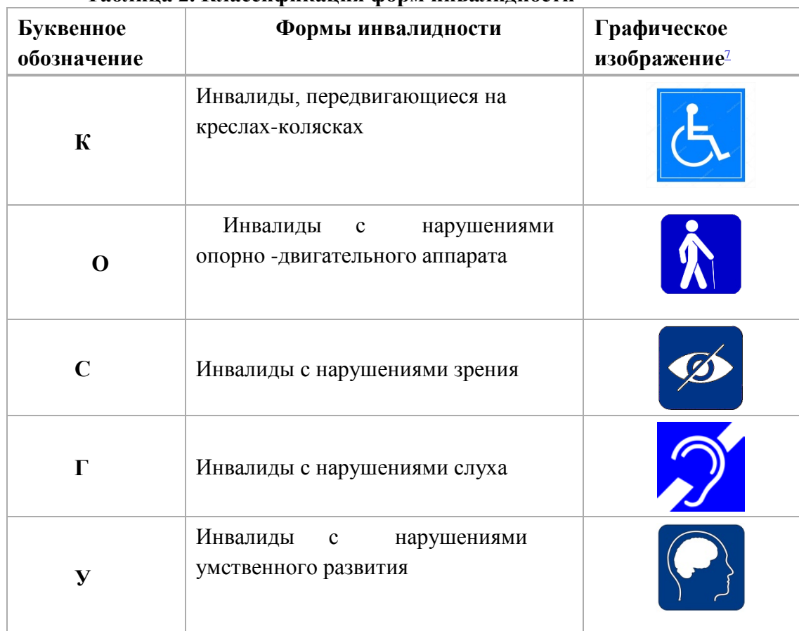
Таблица 2. Классификация форм инвалидности

В зависимости от формы инвалидности лицо сталкивается с определенными барьерами, мешающими ему пользоваться зданиями, сооружениями и предоставляемыми населению услугами наравне с остальными людьми.